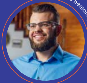
Bolesnik s hemofilijom