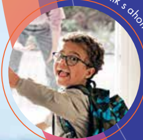
Bolesnik s ahondroplazijom