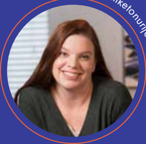
Bolesnica s fenilketonurijom