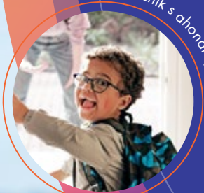
Bolesnik s ahondroplazijom