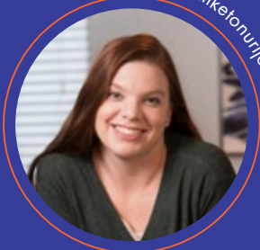
Bolesnica s fenilketonurijom