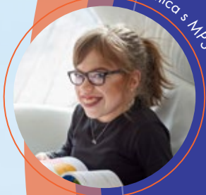
Bolesnica s MPS VI