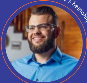
Bolesnik s hemofilijom